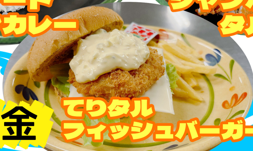
てりてり フィッシュバーガー