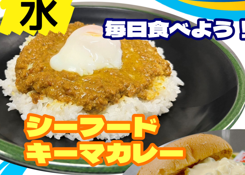
シーフード キーマカレー