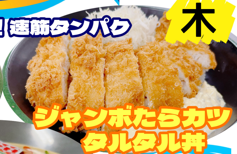
ジャンボたらカツ タルタル丼